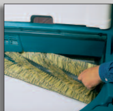
Borsten kan bytas utan verktyg