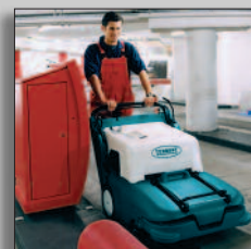
Maskinen i drift