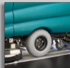
Maskinen i drift