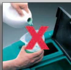
Ingen kladdig dosering och blandning