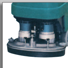
Skursystem med disc