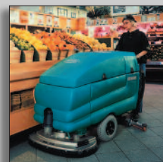
Maskinen i drift