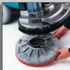
Borstar/rondeller kan bytas utan verktyg