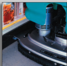
Skurhuvud med låg profil