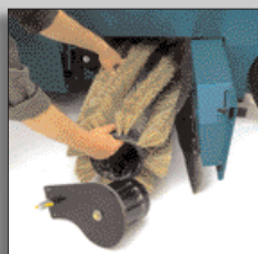
Borsten kan bytas utan verktyg