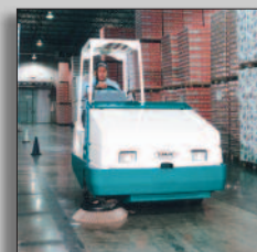
Maskinen i drift