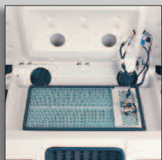
Filter kan bytas utan verktyg