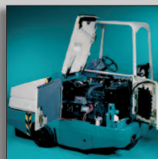
Enkel åtkomst till motorn