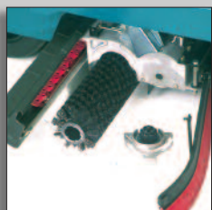
Borstar och skrapor kan bytas utan verktyg