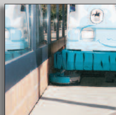
Sidoskurenhet som standard