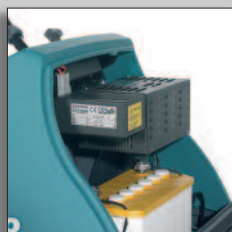
Batteripaket med inbyggd batteriladdare