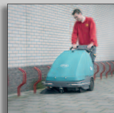
Lättkörd och smidig