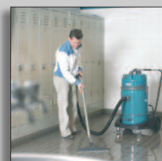
Maskinen i drift