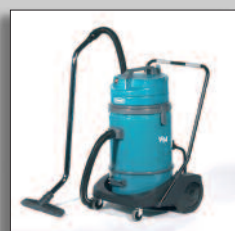
V14 hög kapacitet med tippchassi/vagn