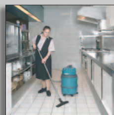
Maskinen i drift