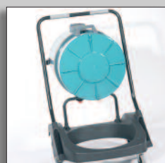
Tippbar tank för enkel rengöring/tömning