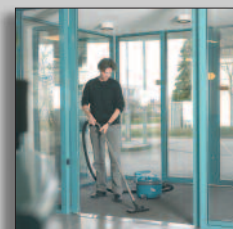
Maskinen i drift