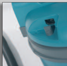
Byte av nätkabel utan verktyg