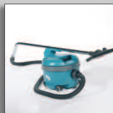
Smart design för handröret